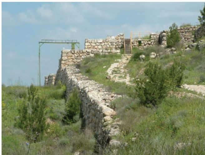
שער העיר לכיש

בחרס מס' 4 שורות 10-13 כותב הפקוד למפקדו: "יודע כי את משאת לכש נחנו שמרם ככל האתה אשר נתן אדני כי לא נראה את עזקה". מתברר שהושעיהו ישב בנקודת תצפית בין לכיש לעזקה ועקב אחרי האותות המוסכמים ש"שודרו" משתי ערי מבצר אלה - איתותי משואות האש (בלילה) והעשן (ביום). והנה, בעוד שבפסוקים מירמיהו אנו קוראים כי הן לכיש הן עזקה עדיין מחזיקות מעמד בפני המצור הבבלי, מתוך המכתב מלכיש, שנכתב ימים ספורים אחר כך, אנו מתבשרים כי עזקה כבר נפלה - "כי לא נראה את עזקה", ורק את משאת (משואה בלשון המשנה) לכיש עוד ניתן לראות. הצבא הבבלי הגיע מהים, כמו כל צבא גדול שמעדיף את הכניסה הימית, הבטוחה והקלה יותר. ספינותיו עוגנות באשקלון, אותה כבשו הבבלים לפני שנים רבות. מהחוף מגיעים הבבלים לשפלת יהודה. כל המוצבים שבדרך הם מוצבי הגנה מפני הצבא הזה. על פי הנאמר בירמיהו אנחנו לומדים שרק עזקה ולכיש עוד נותרו מכל ערי השדה במעוזים האחרונים מחוץ לירושלים. הזיקה