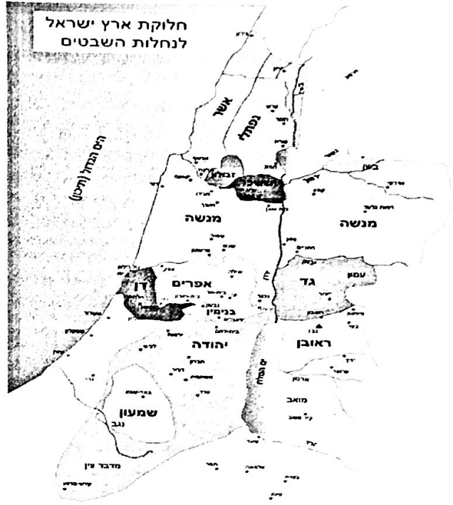
חלוקת ארץ ישראל לנחלות השבטים